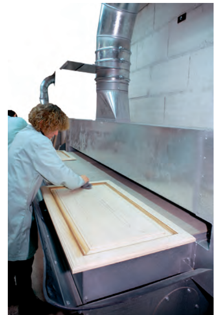
Une solution bien adaptée au ponçage : la table aspirante