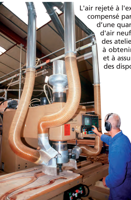
Un secteur du capot a été déposé

L'air rejeté à l'extérieur doit être compensé par l'introduction d'une quantité équivalente d'air neuf, pris à l'extérieur des ateliers, de manière à obtenir les débits requis et à assurer l'efficacité des dispositifs de captage.