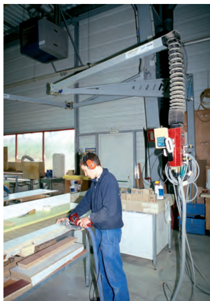
Les machines portatives doivent être équipées d'une aspiration intégrée raccordée à un système spécifique à haute dépression